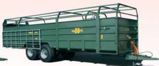
Typ Trimax 9.55