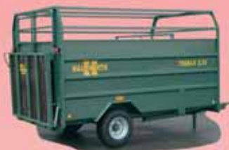
Typ Trimax 3.70