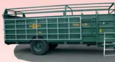
Typ Trimax 6.35-1