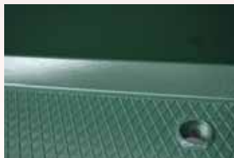
Seitenwände in 45° Winkel, mit Bodenblech verbunden um die Reinigung zu erleichtern.