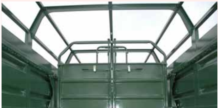
Innenabtrennung auf dem Rahmen mit vierfachem Verschluss.