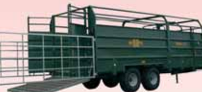
Typ Trimax 6.35-2