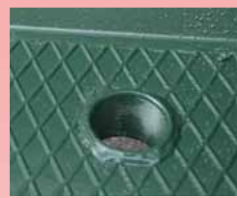
Bodenschüssel 60 mm hoch mit Ablassstoffen