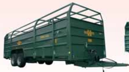
Typ Trimax 8.05