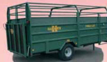
Typ Trimax 5.25