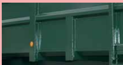
Seitenbleche aus glattem Blech 3 mm dick Bodenblech 3/5 mm dick

Aufbau unverformbar mit Verstärkungen unten am Gehäuse und an den Pfosten (150 mm) 3 ausgearbeitete, horizontale Streben.