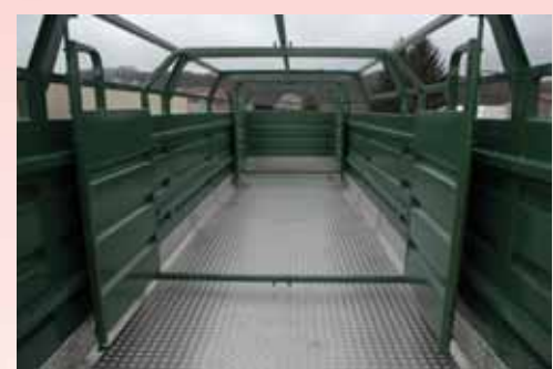
Aluminium- Ryfelblechboden 4 - 6 mm dick mit 20 cm Bodenerhöhung auf den Seiten.