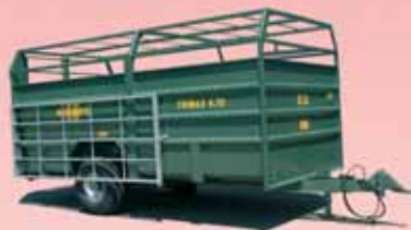
Typ Trimax 4.75