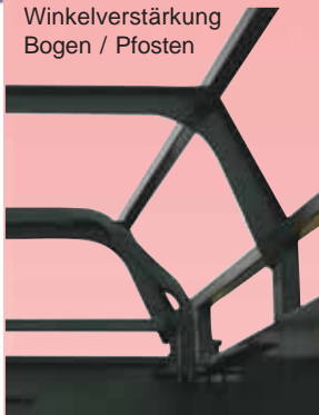
Winkelverstärkung Bogen / Pfosten

Maximaler Rostschutz bei der Oberflächenbehandlung durchgeführt in Form von Phosphorisierung, Lackierung und Trocknung des Aufbaus.