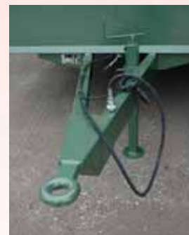
Rechteckiger Stützfuß von 70 mm (auf 4,25) und Feststellbremse