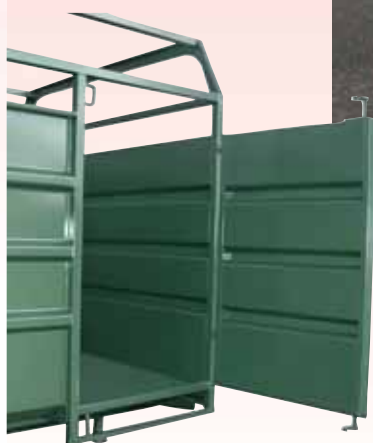
Seitentür 0,90 m breit, mit Trittbrett

Das Beladen ist erleichtert durch: - 2 Hecktüren mit grosser Breite: 1,80 m - 1 abgesenkten Boden - 1 Verloaderampe, die «mit einem Hand» wieder anzuheben ist und grosser Breite.