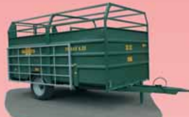
Typ Trimax 4.25