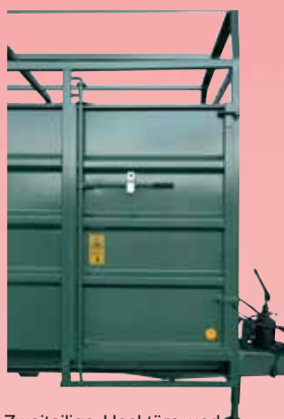
Zweiteilige Hecktüre und Seitentüre