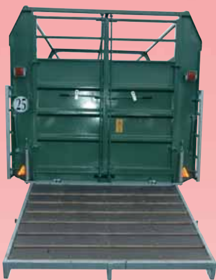
Seitenblech von Höhe 1,50 m

Entspricht den tierärztlichen Verordnungen