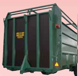
Hydraulische Laderampe (hier geschlossen)