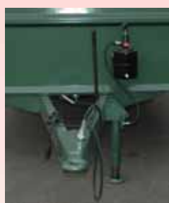
Hydraulischer Stützfuss mit Pumpe