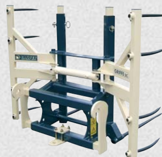
Griffe double compacte

manutention balles rondes et rectangulaires