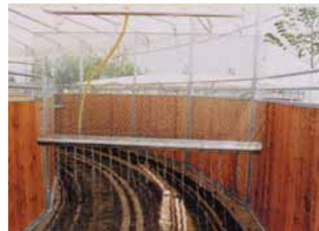
Séparation grillagée et système d'arrosage