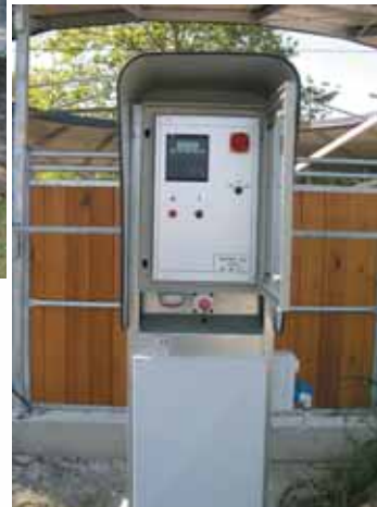
Colonne de commande