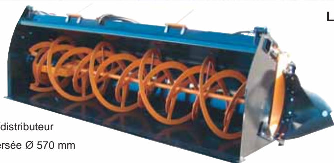
Mélangeur/distributeur à spire inversée Ø 570 mm

La solution pour mélanger et distribuer avec précision les concentrés et les céréales