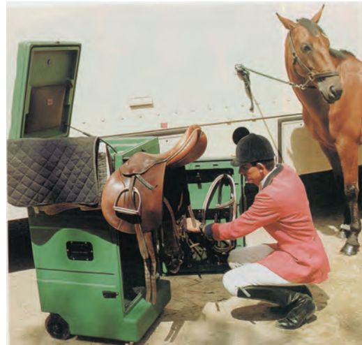
Malle roulante, largeur 60 cm, profondeur 65 cm, hauteur 126 cm