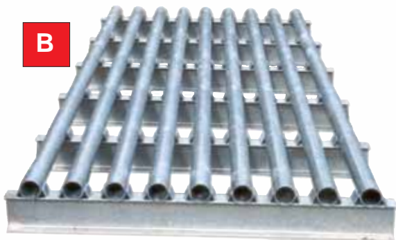
ERPP16 / ERPP17

En option, barrières latérales hauteur totale 1,35 m / hors-sol: 1,10 m.