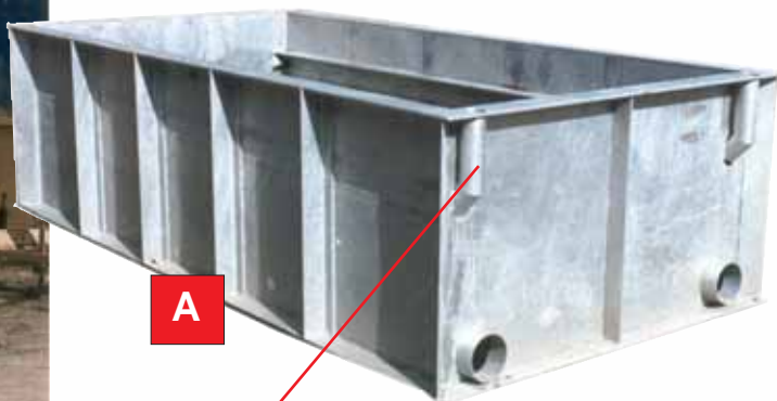
Fourreau pour barrière ERPP42 en standard