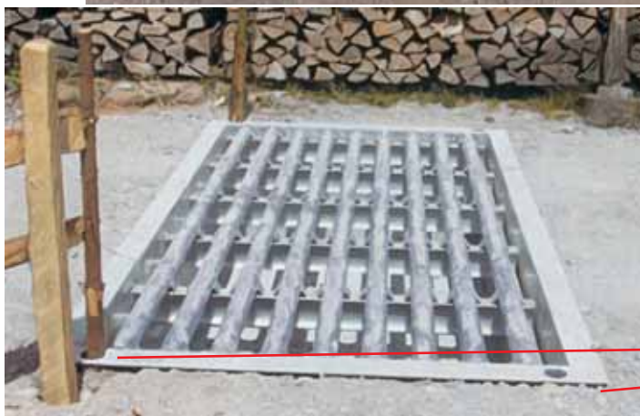
ERPP40 / ERPP41