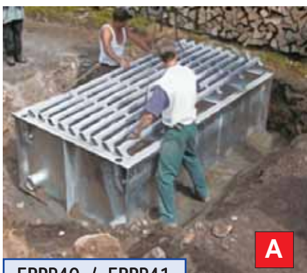
ERPP40 / ERPP41

Permet le libre franchissement de tous véhicules en maintenant les animaux parqués. Prêt-à-poser au fond d'une fosse (remblayer le pourtour), adapté pour tous les animaux d'élevage (ovins, bovins, ...) et autres (sangliers, cervidés, ...)